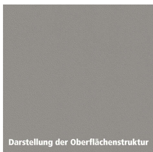
Darstellung der Oberflächenstruktur

Arbeitsplatte aus einer Holzspanplatte Typ P2, die Dekorseite ist mit einem HPL verklebt, die Rückseite mit wasserabweisendem Gegenzug. Die Oberfläche des Schichtstoffs ist kratzfest, lebensmittelecht, wasserfest und pflegeleicht. Als Holzwerkstoff sind unsere Arbeitsplatten leicht zu verarbeiten und einzubauen.