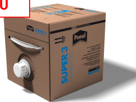
Ponal Super 3 Holzleim in der 9kg Leimbox