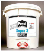
Ponal Super 3 Holzleim