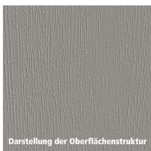
Darstellung der Oberflächenstruktur