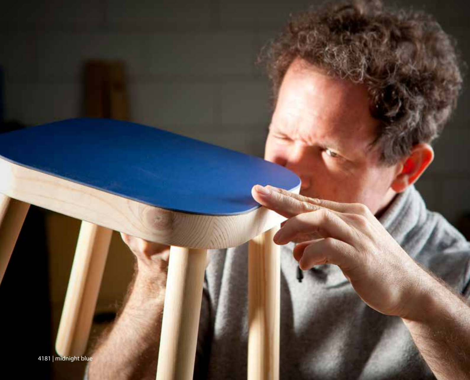
4181 | midnight blue

1. Kleben Sie den mit einer 1%igen Zugabe geschnittenen Belag auf das Trägermaterial. (Damit in der späteren Oberfläche keine Unebenheiten sichtbar werden, empfehlen wir den Klebstoff mit einer Lammfellrolle aufzutragen.) / Collez le revêtement une fois découpé avec un excédent de 1 % sur le matériel de support. (afin qu'aucune irrégularité n'apparaisse ensuite sur la surface, nous vous recommandons d'appliquer le matériel adhésif avec un rouleau en peau d'agneau.)